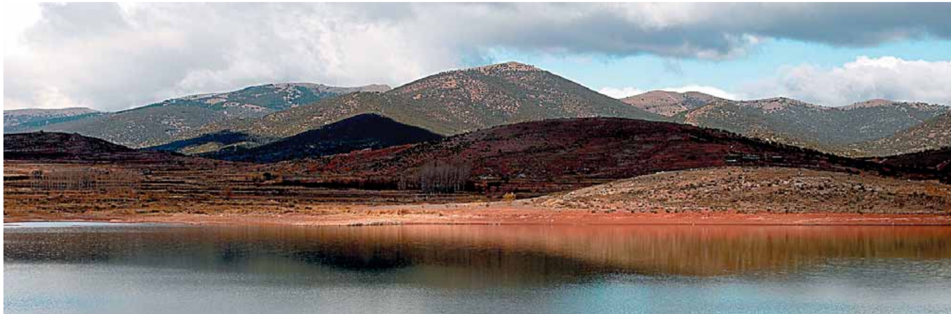
Embalse de Maidevera.