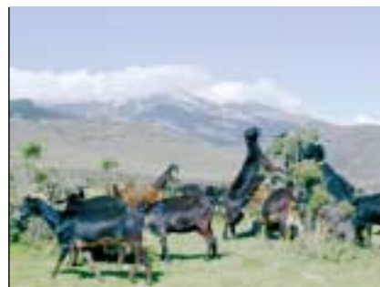
Ejemplares de cabra moncaína con el Moncayo al fondo.

No obstante, y en previsión de futuras realizaciones, desde el Consejo Asesor del II Catálogo Aragonés de Buenas Prácticas Ambientales se recomienda no actuar en los cauces que atraviesan la finca, ya que por sus dimensiones y características no requieren ningún tipo de acondicionamiento. Por el contrario, y de acuerdo con los objetivos ambientales del proyecto, deberían conservar su naturalidad y funcionalidad como cursos de agua.